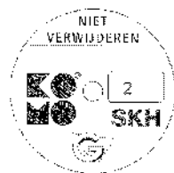
geschikt voor weerstandsklasse 2